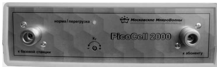
Лицевая панель ретранслятора

На лицевой панели ретранслятора располагаются коаксиальные соединители для подключения антенных кабелей. Тип соединителей – N Female (розетка типа N). Соединитель с маркировкой «к базовой станции» предназначен для подключения радиочастотного кабеля наружной антенны, направленной в сторону базовой станции. Соединитель с маркировкой «к абоненту» предназначен для подключения радиочастотного кабеля внутренней антенны, направленной в зону обслуживания абонентов.