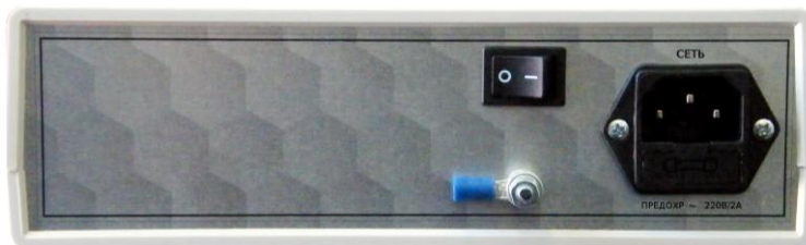
Задняя панель ретранслятора

На лицевую панель ретранслятора выведен шлиц потенциометра регулировки коэффициента усиления K υ в пределах 15 дБ. При выпуске потенциометр регулировки коэффициента усиления устанавливается в положение максимального усиления (по часовой стрелке до упора).